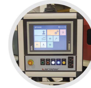
Controller Unit Kontrol Ünitesi