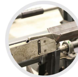
Feeding arm Sürme kolu